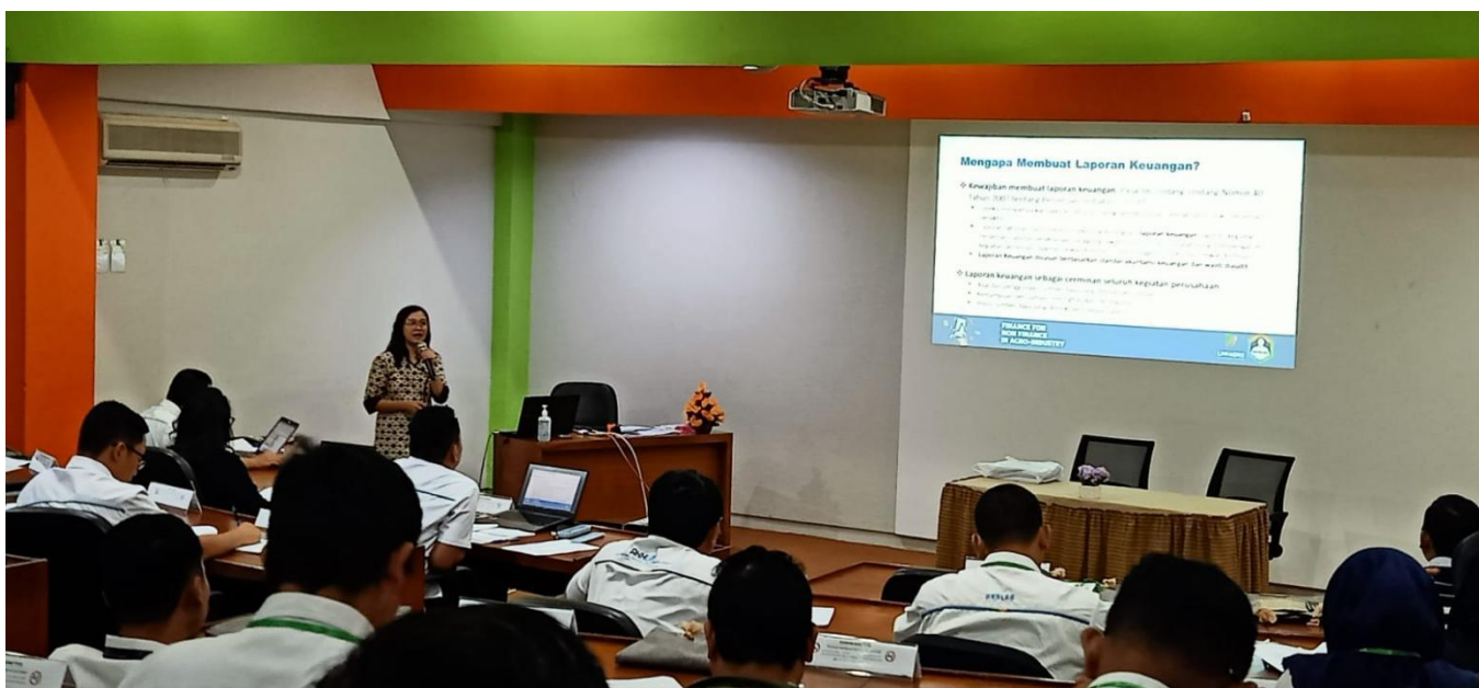
Dokumentasi Foto Kegiatan